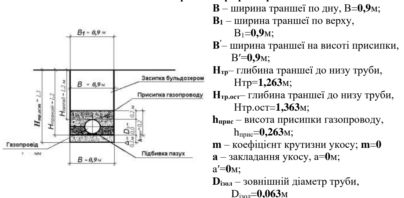
Рис. 2.1 Поперечний профіль траншеї

Викреслюю поперечний переріз траншеї з визначеними розмірами, відповідно розрахунків.