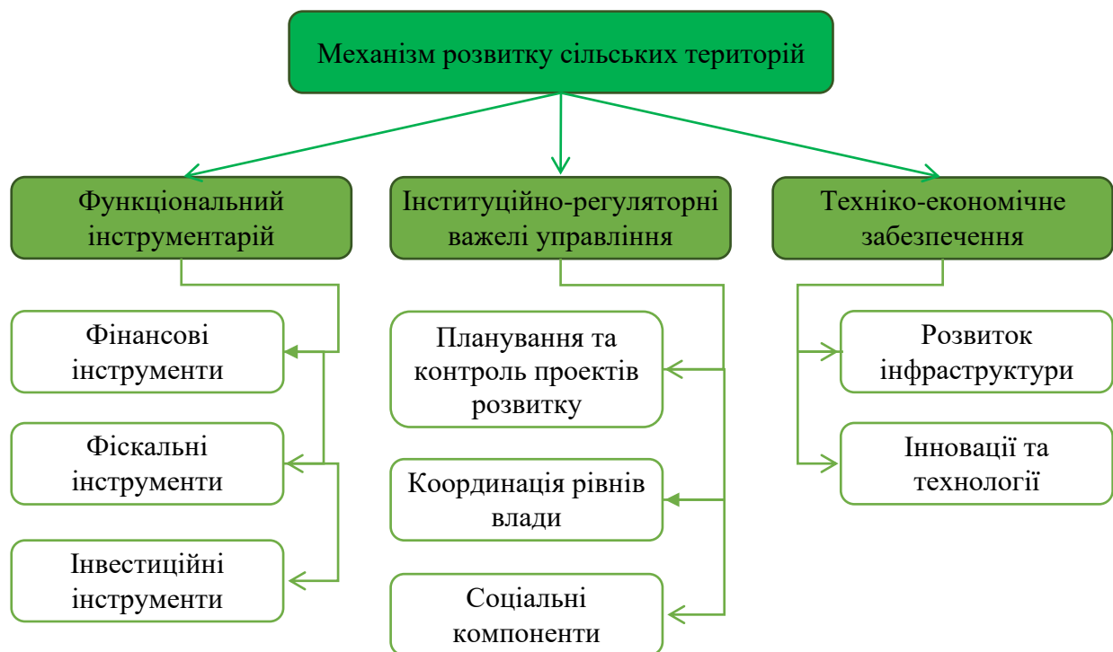
Рис. 2. Економічний механізм політики розвитку сільських територій

Таким чином, економічний механізм розвитку сільських територій є багатокомпонентним за своєю структурою та передбачає наявність функціональних, інституційних та техніко-економічних складових (рис. 2).